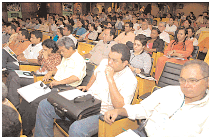
APRESENTAÇÃO ■ Platéia lotada no auditório do Banco da Amazônia